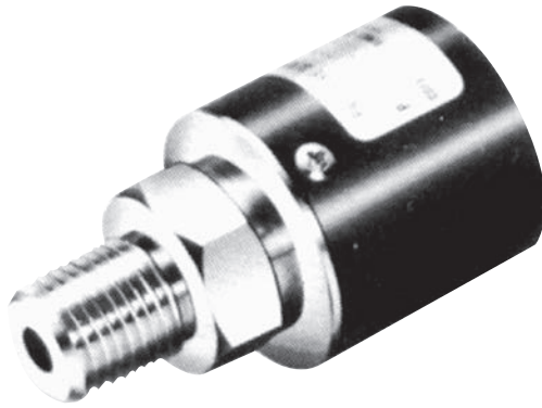
PA 500, PS 5