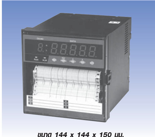
ขนาด 144 x 144 x 150 มม.