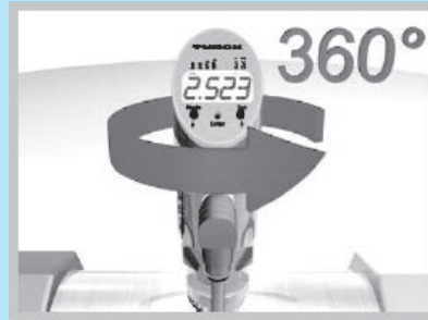
รุ่น PS...5 หน้าจอหมุนได้