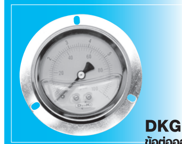
DKG-T ข้อต่อออกด้านหลัง